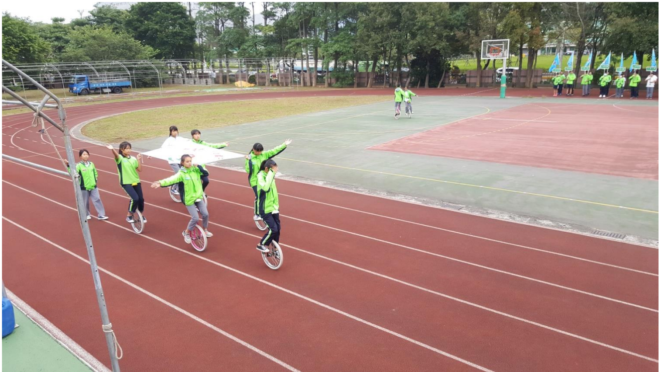
同學們利用放學或午休練習運動會護旗進場工作