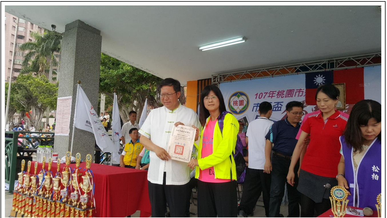
2018 年 5 月桃園市運動會市長盃獨輪車錦標賽