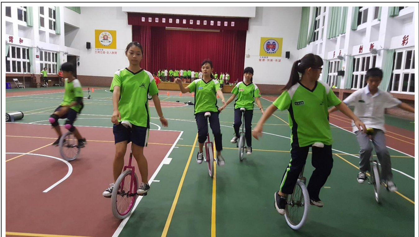
準備比賽，同學們都利用放學或假日都到學校練習