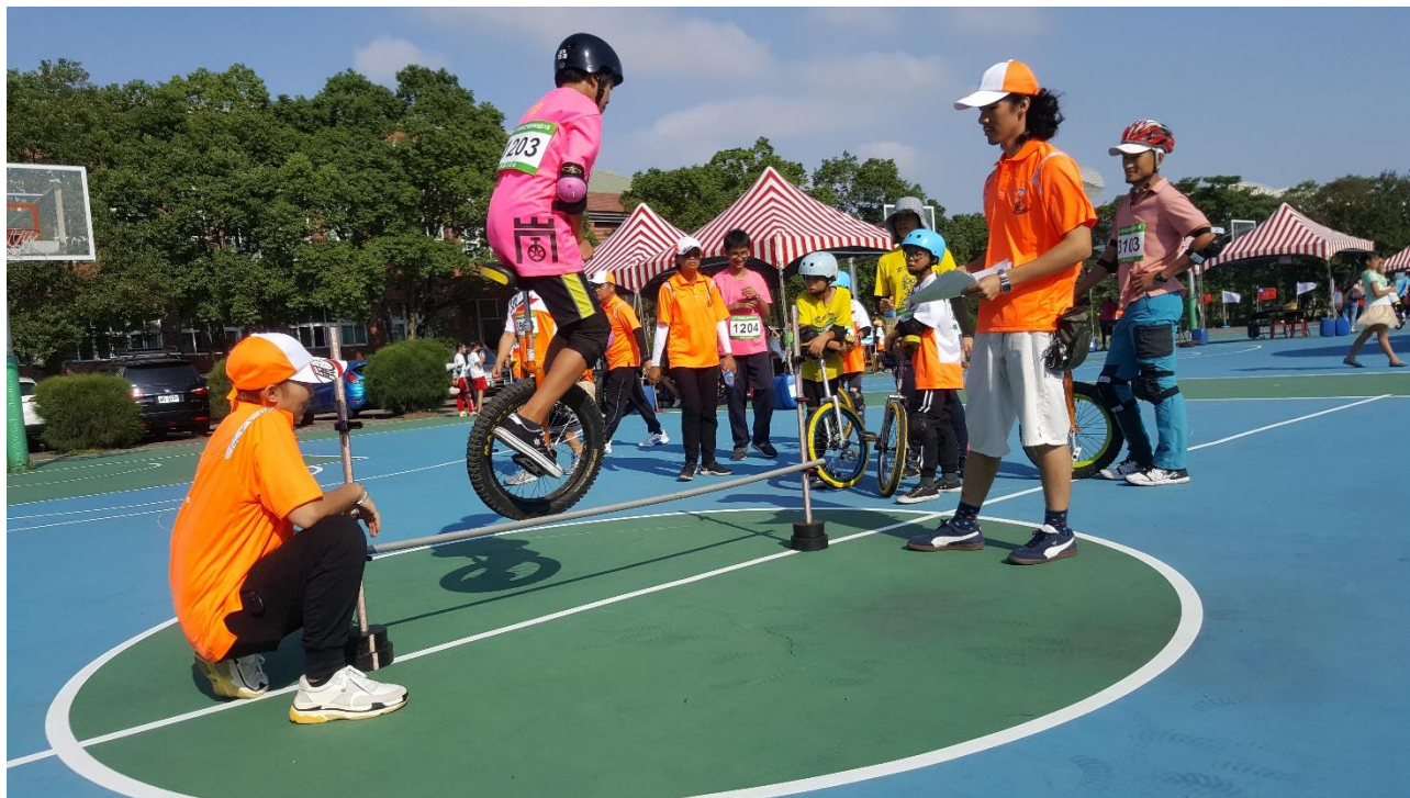
2018 年 10 月 桃園盃全國飄獨輪運動大會