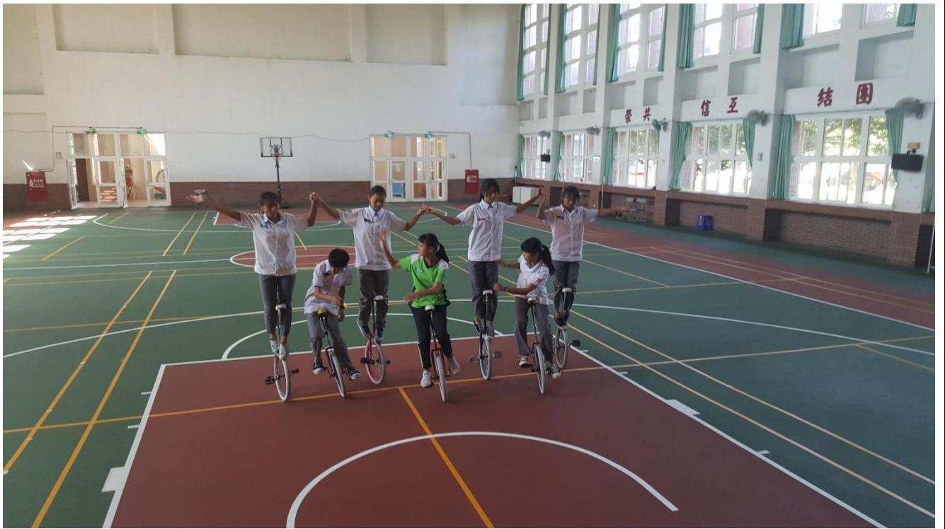
準備比賽，同學們都利用放學或假日都到學校練習