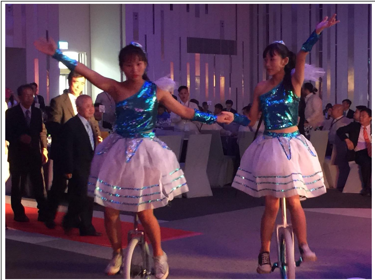
獨輪車社員參加中壢青商會晚會表演