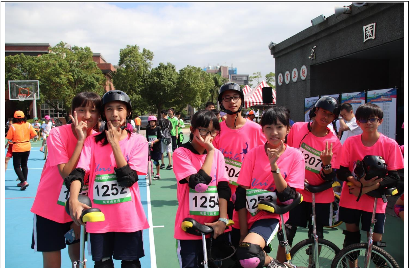
2018 年 10 月 桃園盃全國飄獨輪運動大會