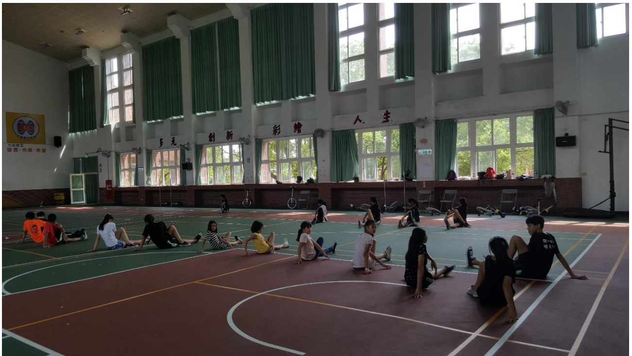
2018 年獨輪車暑假育樂營練習花式動作