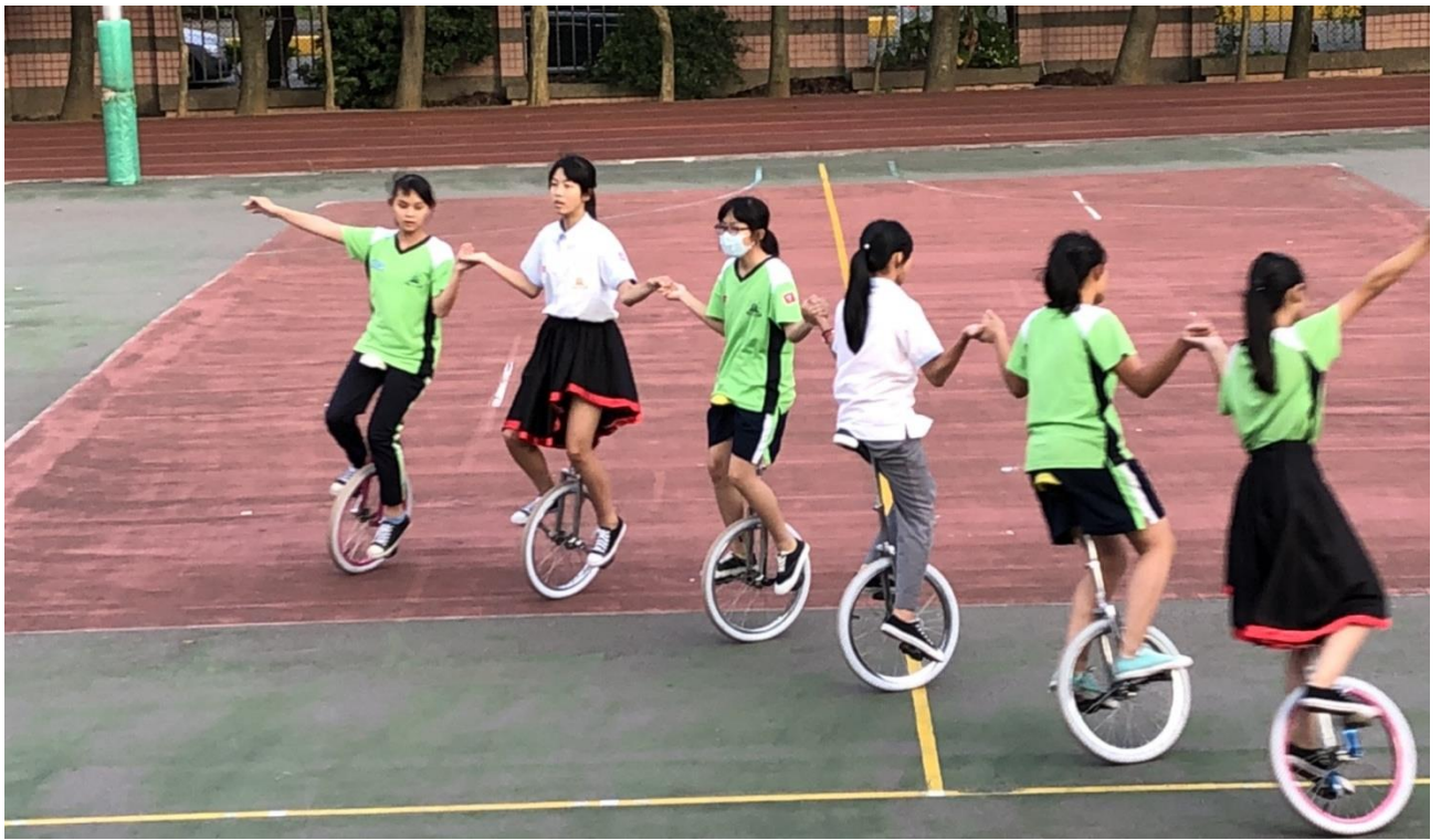
準備比賽，同學們都利用放學或假日都到學校練習